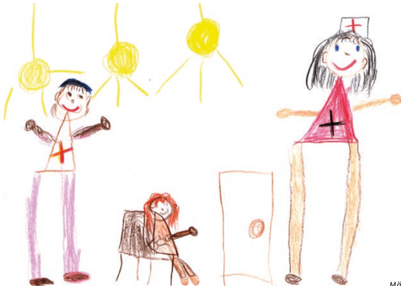
Mädchen 5,11 Jahre