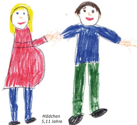
Mädchen 5,11 Jahre

Wir bieten Elternabende mit Experten/Expertinnen zu diesem Thema an und vermitteln bei Bedarf auch Kontakt zu Beratungsstellen.