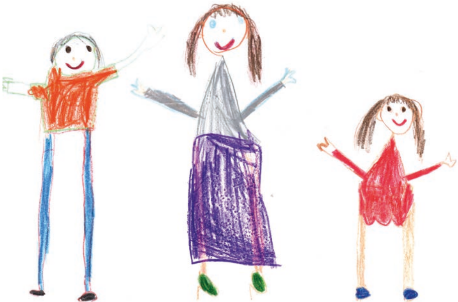
Mädchen 5,11 Jahre

Dies stärkt das Selbstvertrauen und die Selbstwertentwicklung des Kindes. Das Erkunden des eigenen Geschlechts und Berühren der Geschlechtsteile ist immer wieder Alltag in der Einrichtung. Deshalb ist uns hohe Transparenz zu diesem Bildungsthema mit Kindern und Eltern wichtig.